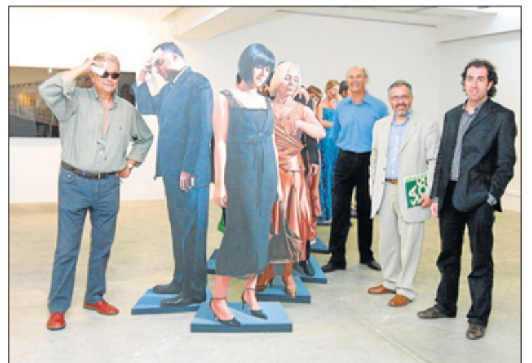
Die Grenzen zwischen Realität und Phantasie verwischen sich