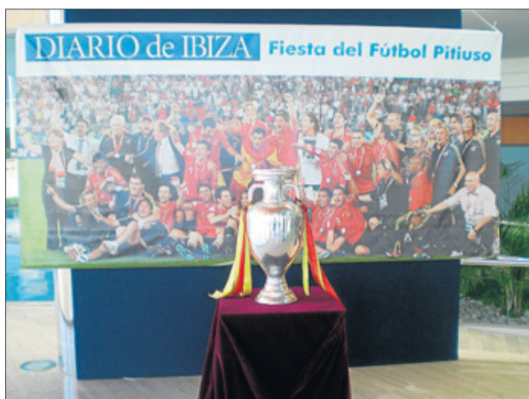
Der Europapokal ist für das Fussballfest in der Messehalle hier PH

Der Vorteil für den Benutzer liegt in der Möglichkeit ein Verbundkarte zu kaufen, die ihn in alle Ortschaften der Inseln bringt, ohne jedesmal ein neues Ticket lösen zu müssen. Mit ihr wird jede Fahrt außerdem billiger.