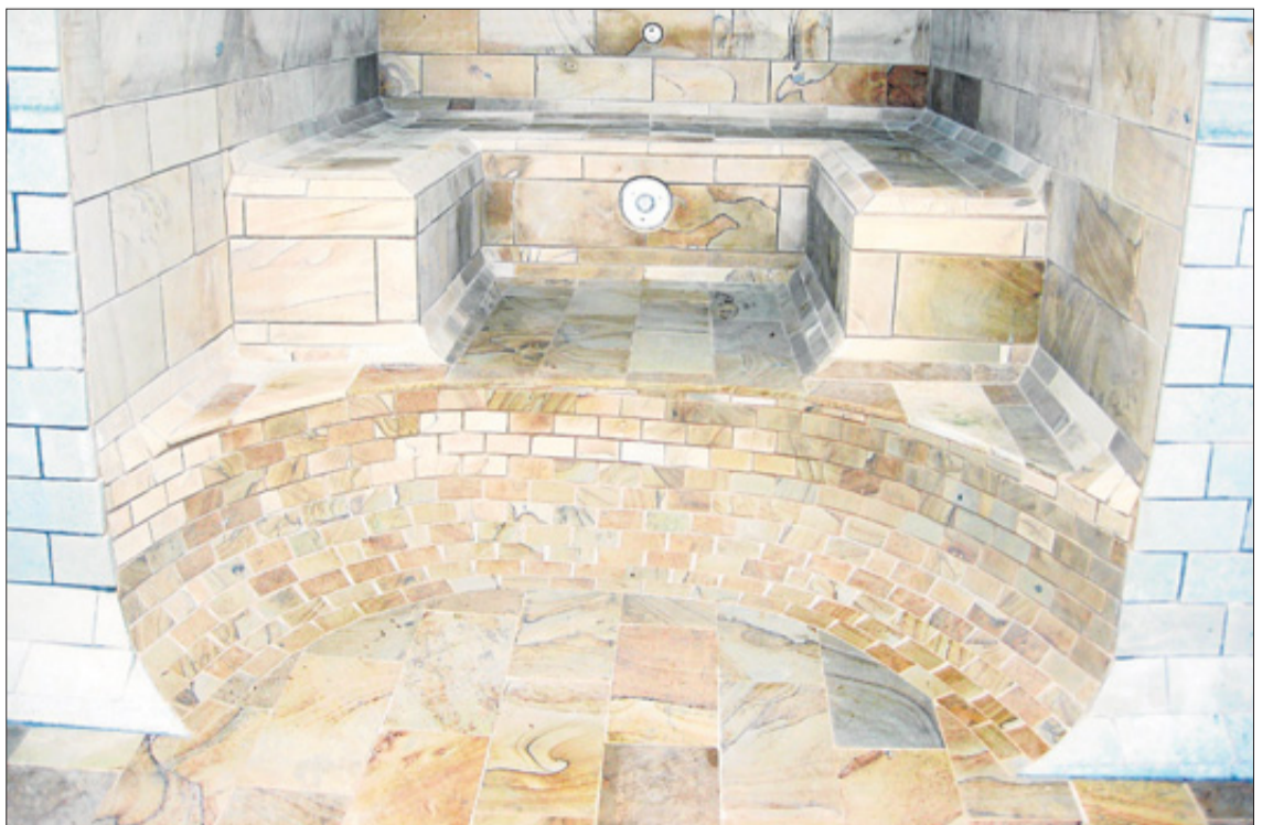
M&amp;S Bauservice erfüllt jeden Wunsch