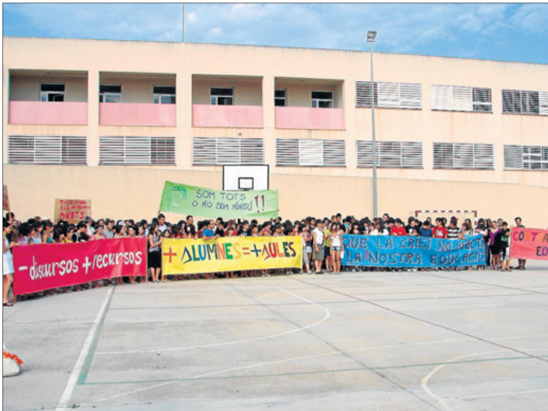
Lehrer, Eltern und Schüler demonstrieren im Institut von Formentera