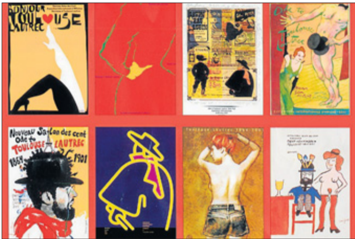
Acht Plakate der Ausstellung