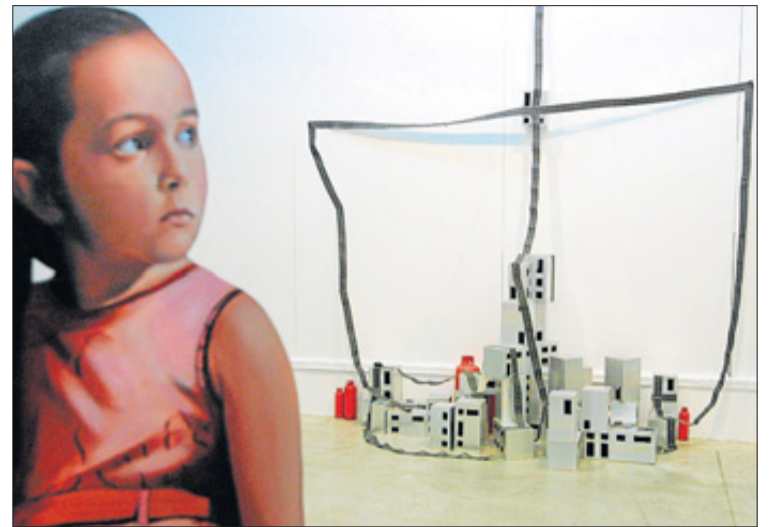
Ein Teil der Installation in Sa Nostra

TALAMANCA STRANDNÄHE , möbliertes Penthaus zu vermieten, ca. 300m 2 , 3 Schlafzimmer, 3 Bäder, Pool, grosse Terrasse, auch längerfristig. 2.500.-Euro/Monat + Nebenkosten. Kaution 3 Monatsmieten. Tel.: 971.314.684.