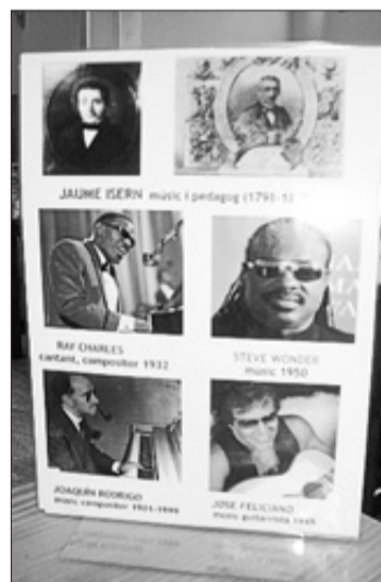
Mostra de músics cecs.