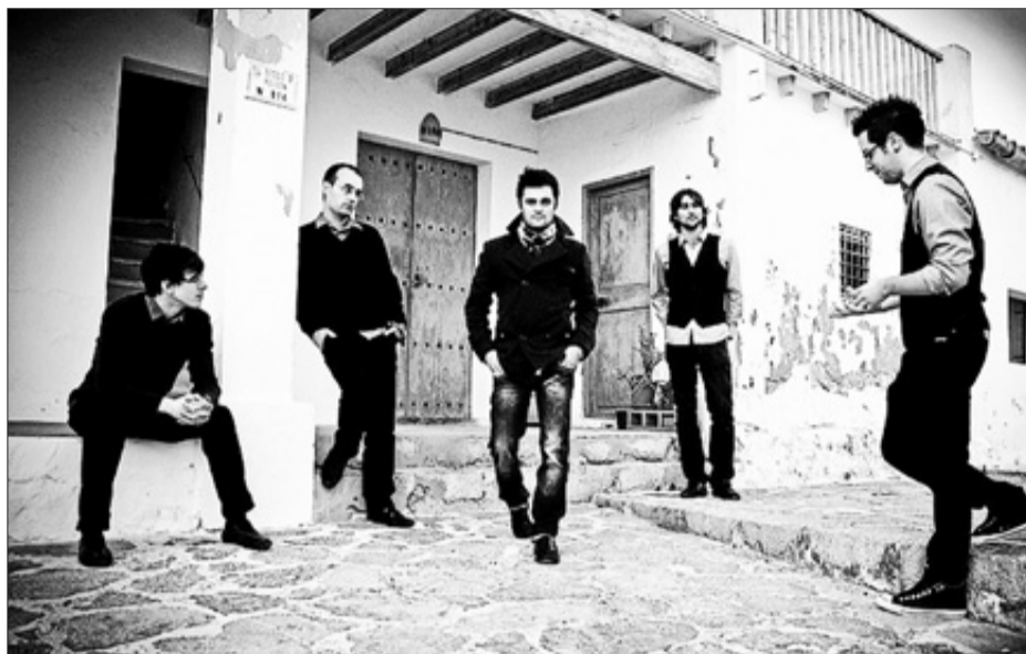
Imatge promocional del grup Quin Delibat!. JOSEP COSTA