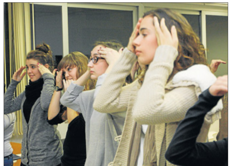
Un grup d'alumnes fa exercicis de relaxació. M. COPA

Es fomenta la convivència amb viatges, intercanvis anuals amb cors de la Península i estades de cap de setmana amb les monges des Cubells per preparar concerts